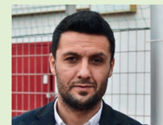
Yildiray Bastürk, ehemaliger Spieler des VfB Stuttgart und gebürtiger Herner.

zum Glück ist es heute längst kein Widerspruch mehr, Sohn einer Familie mit Wurzeln in der Türkei und gleichzeitig „Kind des Ruhrgebiets“ mit großer Identifikation für Herne und die Region drum herum zu sein. Im Ruhrgebiet und insbesondere in seinen Städten wie Herne wurde und wird Integration seit jeher groß geschrieben. Und das ist auch gut so.