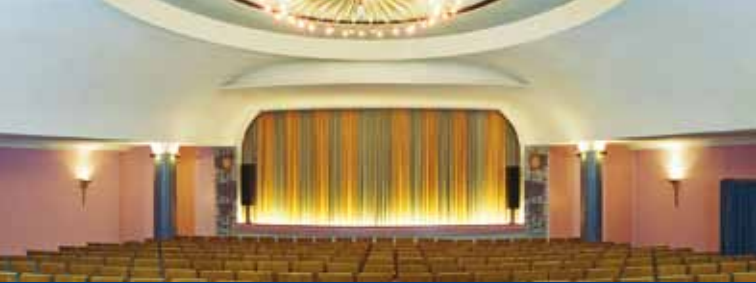
EULENSPIEGEL FILMTHEATER • FILMSTUDIO GLÜCKAUF