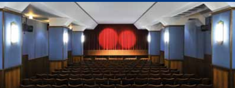
ASTRA-THEATER & LUNA • GALERIE CINEMA